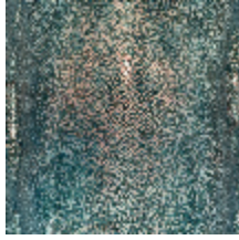
3326-02 PRECIEUX BLEU