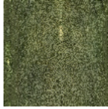
3326-04 PRECIEUX VERT