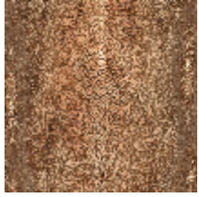
3326-01 PRECIEUX CUIVRE