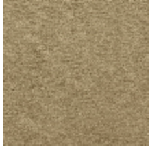
0614-01 COSSE - PAILLE