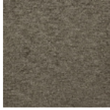
0614-03 COSSE - TERRE