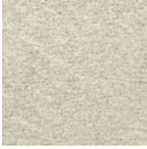
0614-02 COSSE - FICELLE