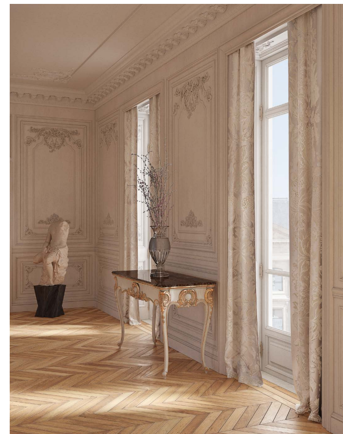
Rideaux Les Ananas, col. Nacre