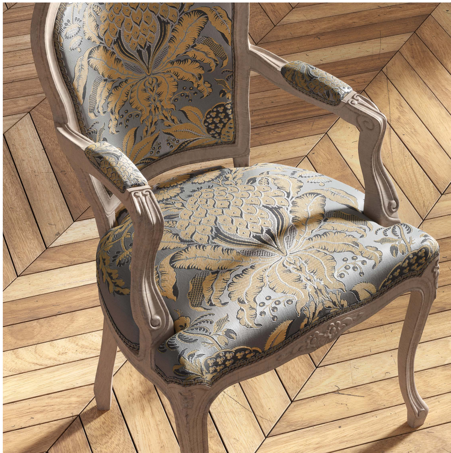
Fauteuil Les Ananas, col. Opale