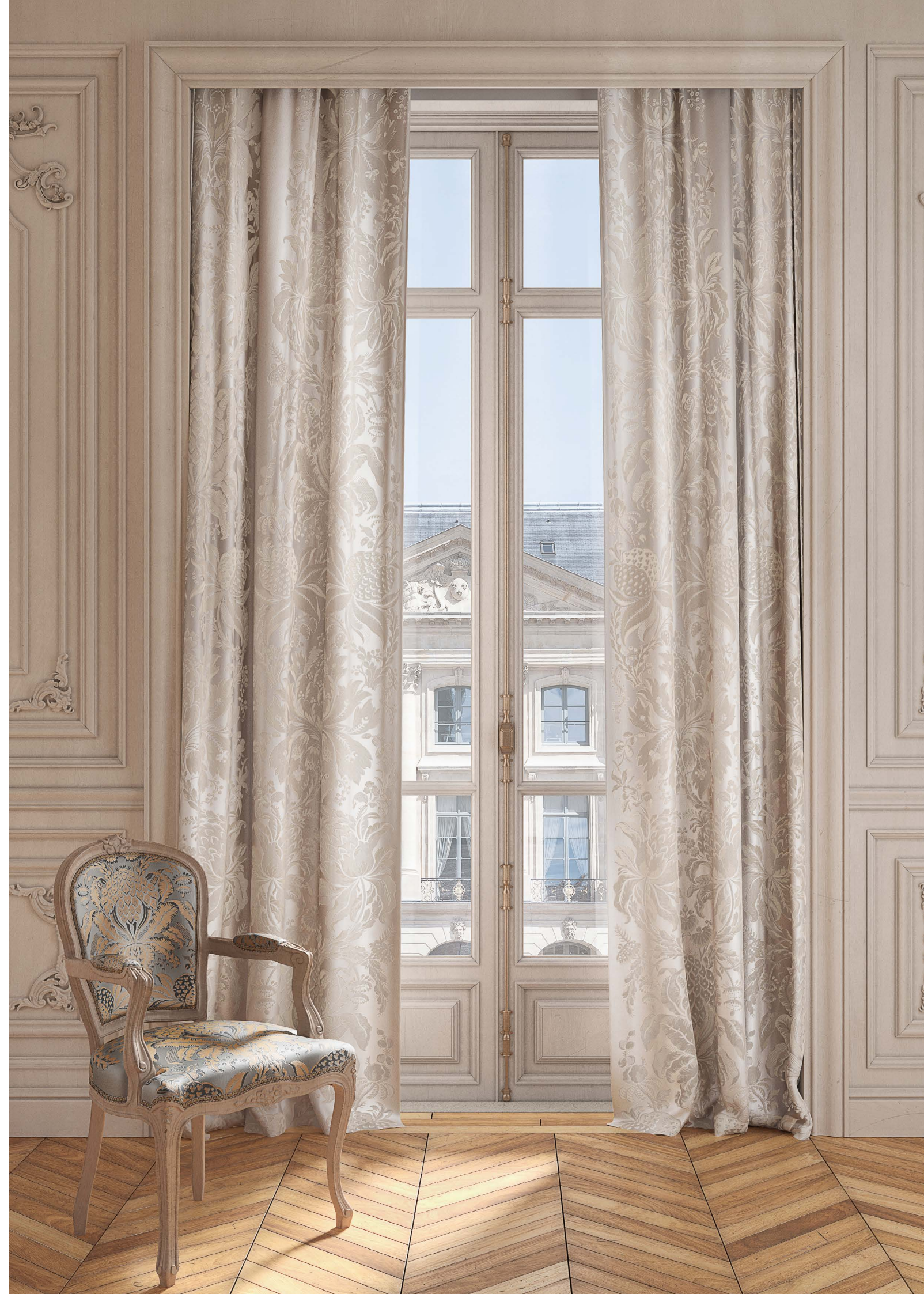
(c) Les Ananas, col. Opale (fauteuil) col. (rideaux)

Ce lampas 100% soie au touché doux et souple est tissé dans notre manufacture dans la région Lyonnaise.