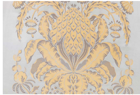
(a) Les Ananas, col. Opale