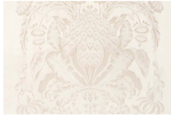
(b) Les Ananas, col. Nacre