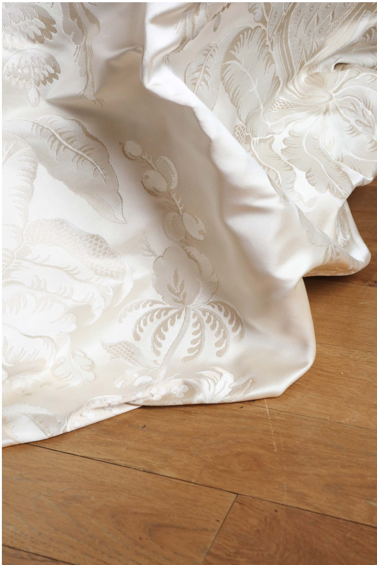
Rideaux Les Ananas, col. Nacre