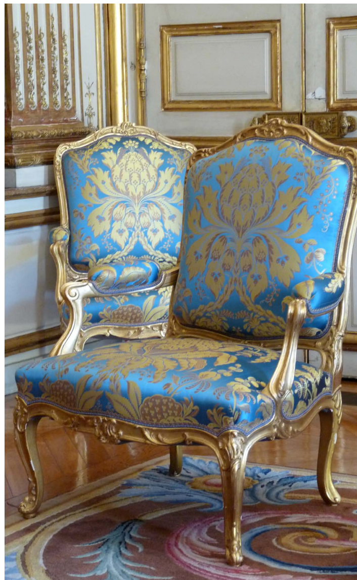
Salon Pompadour, Palais de l'Élysée