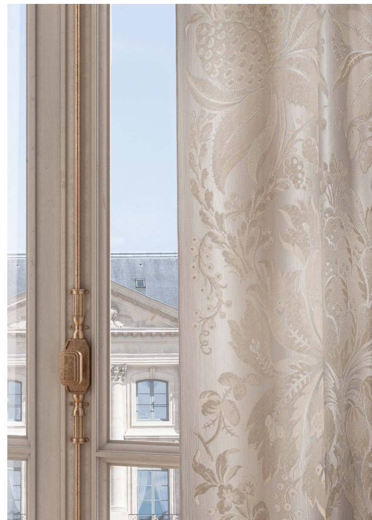
Rideaux Les Ananas, col. Nacre